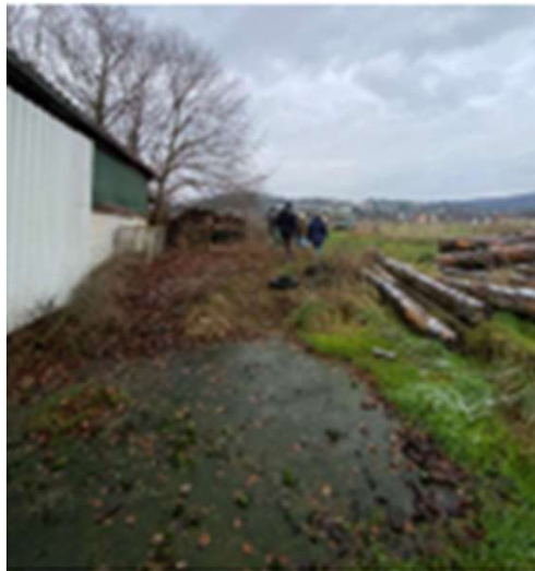
Östlicher Teil des Offenstalls Platz für 6 Pferde