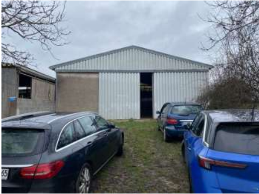
Südlicher Eingang Offenstall Platz für 2 Pferde