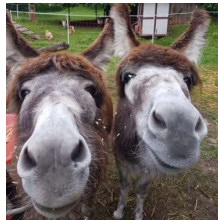
Pferde und Esel in Not e.V.